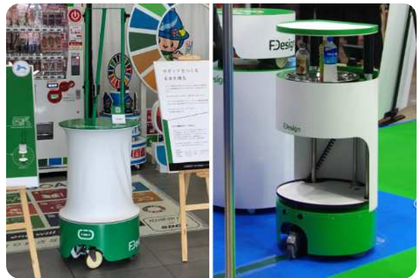
【ロボットベースの活用例】 左：農業支援ロボット 右：配膳ロボット

● 会社概要 株式会社 F-Design 代表取締役 藤本 恵介 TEL 042-770-9607 HP https://f-ds.jp/