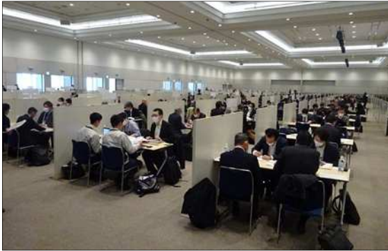
令和5年度に実施した「九都県市合同商談会2024」の商談風景 (会場: パシフィコ横浜 アネックスホール)

首都圏産業の国際競争力の強化を図るため、平成20年度から九都県市(埼玉県、千葉県、東京都、神奈川県、横浜市、川崎市、千葉市、さいたま市、相模原市)が連携して合同商談会を開催し、今回で17回目を迎えます。