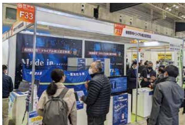
テクニカルショウヨコハマへの出展