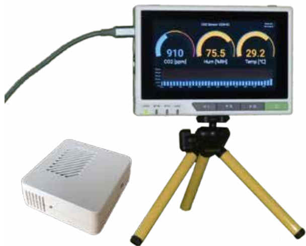
注) 三脚は別売です。他に電源アダプタなどが付属します。